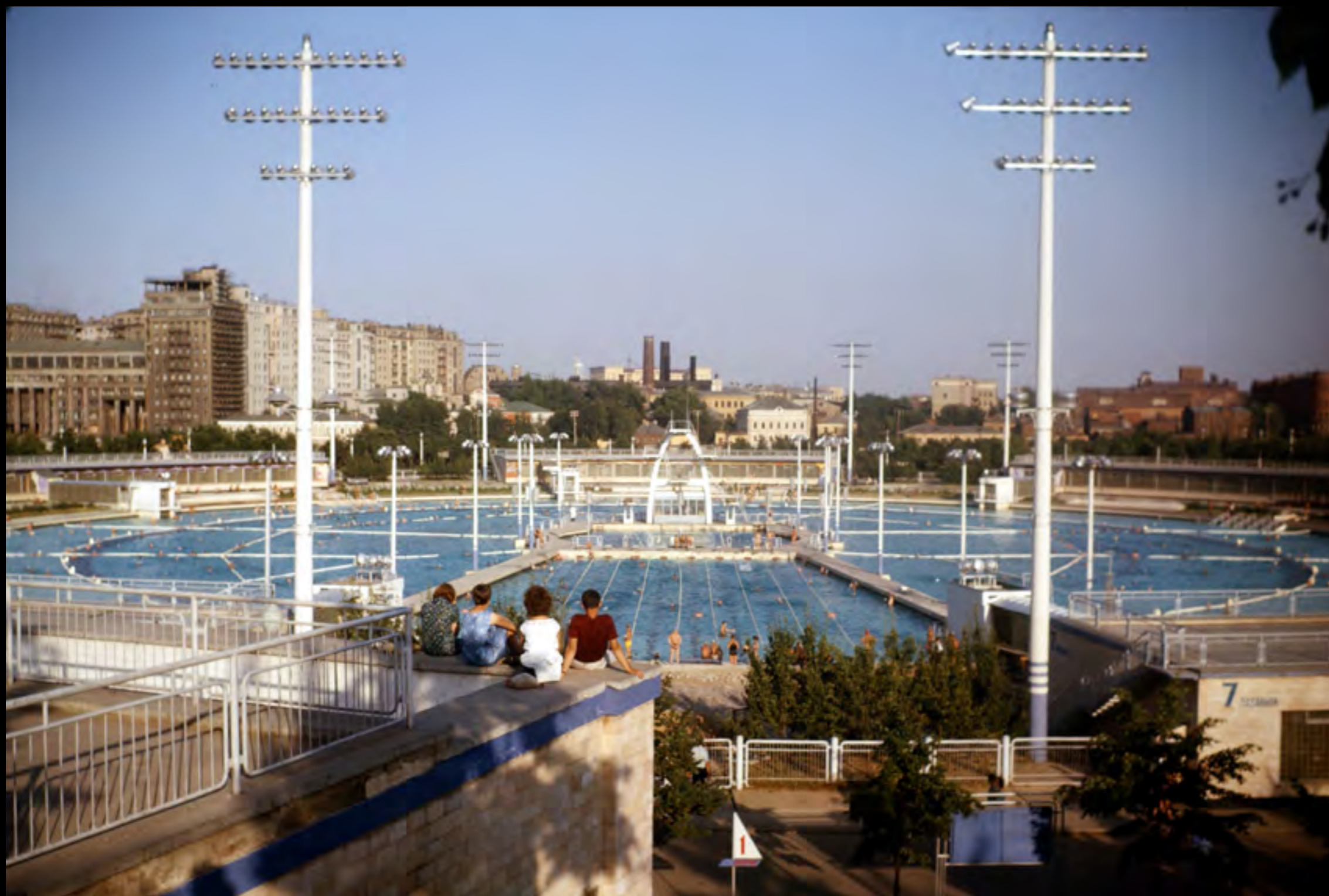
LA GRANDE PISCINE DÉCOUVERTE MOSCOU (1964)