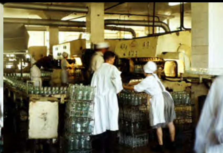
VISITE DE LA LAITERIE DE TBILISSI VOYAGE EN CAUCASE ET GÉORGIE (1964)